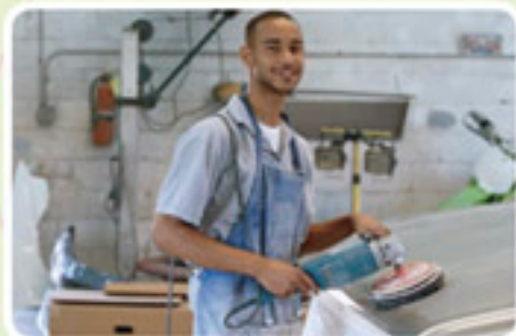
Une carrosserie - 24 salariés Emplois concernés : tôliers, monteurs et peintres.

leur performance se sont engagées dans une réflexion sur les moyens de prévenir ces pathologies.