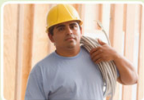
Une entreprise de BTP - plus de 200 salariés Emplois concernés : coffreurs-bancheurs et ferrailleurs.