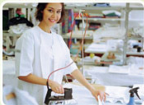
Un pressing - 2 salariés Emplois concernés : repasseuse.