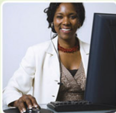
Une administration - 1200 salariés Emplois concernés : agents administratifs.